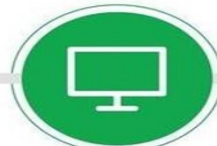
BİLGİSAYAR VE TELEVİZYON