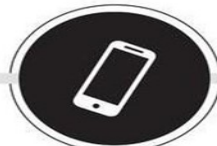
TELEFON VE TABLET